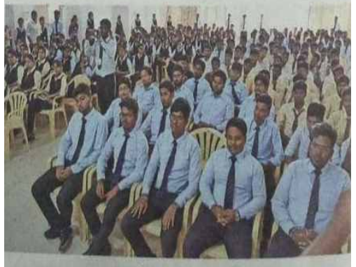
సదస్సులో పాల్గొన్న విద్యార్థులు