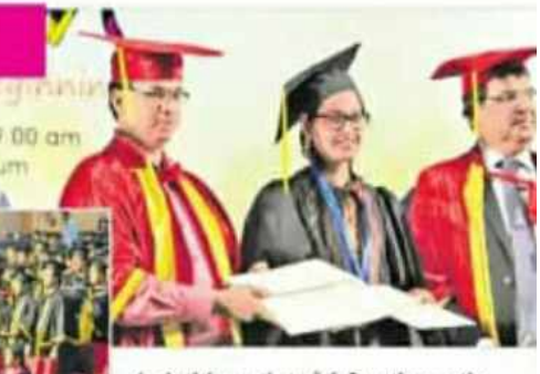
ఈ సందర్భంగా మాట్లాడిన విద్యార్థులు ఆము చదువుతున్న కళాశాల బంగారు బాటేద్దాం... కాలేజీ మొదటి తరముకి జీవితాంతం గుర్తుండిపోతాయన్నారు